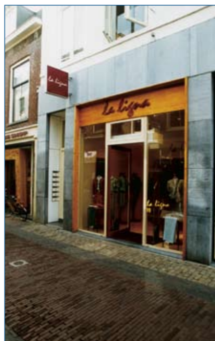
Begane grond met entree appartementen