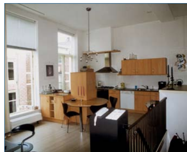
Interieur 1 e etage

opdrachtgever: Vios BV Bouw- en Aannemersbedrijf Utrecht-Amsterdam