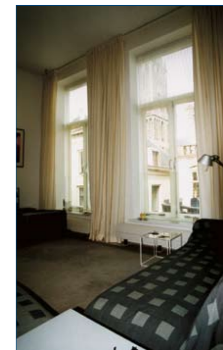
Zicht op Dom