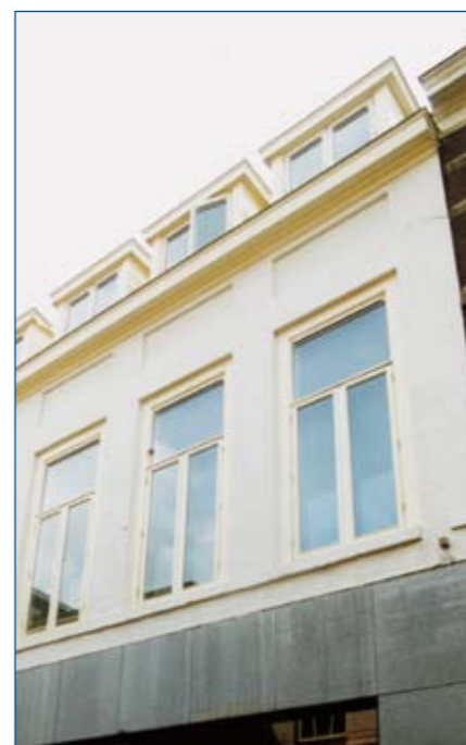
Gevel met extra kap