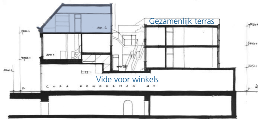
Langdoorsnede, winkel en appartementen. De kap is nieuw toegevoegd