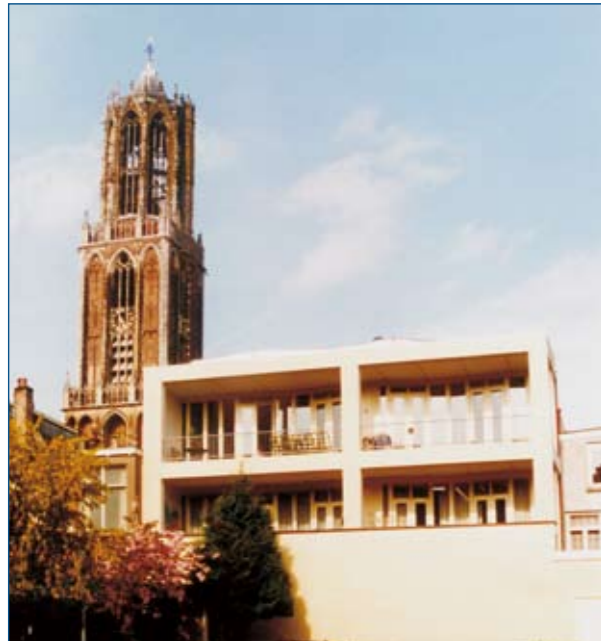
Nieuwe achterzijde met balkons

In Utrecht is de medewerking van winkeliers gering. We hadden geluk bij de opdracht voor de verbouw van twee naast elkaar gelegen winkels. We konden de eigenaar overtuigen van zijn economische belang om, tegen 'inlevering' van 1,2 m 2 etalageruimte, een aantal appartementen erboven te bouwen.