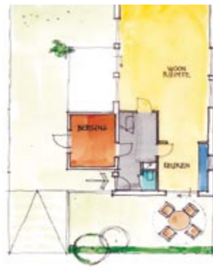
Plattegrond zonder serre voorzijde.