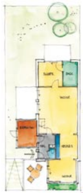
Plattegrond met slaapruijme achter.