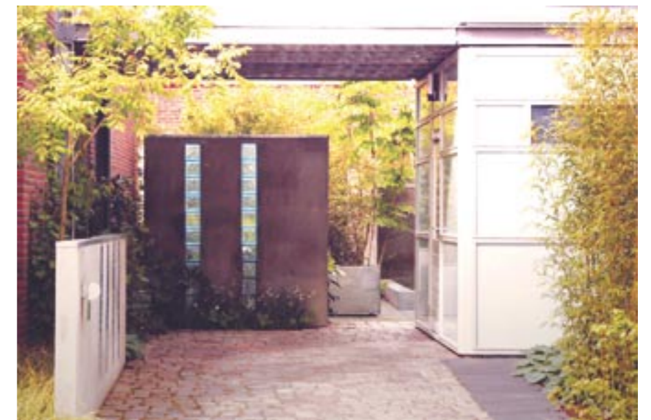
Detail van de doorgang achter, de woningentree naar de tuin.