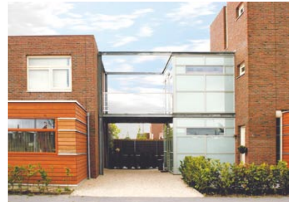
Rechts een woning van 3 etages, links een woning van 2. Beiden hebben de optie voor een vooraanbouw gekozen en een uitbreiding op de 1e etage voor een extra slaapkamer.

Architecten: Anke Colijn, Monique Rijksen