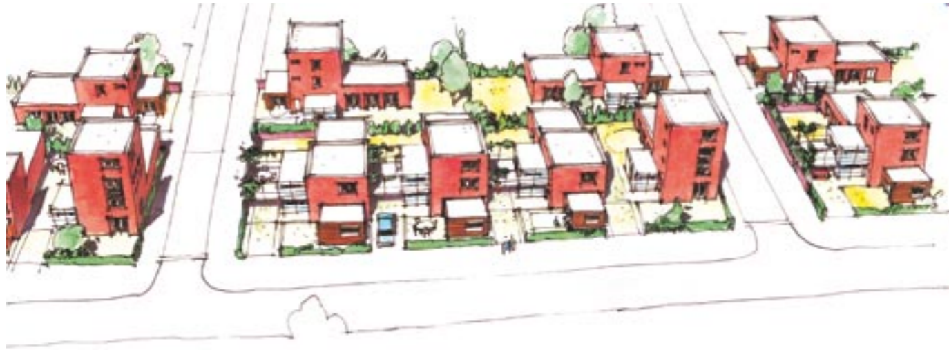
Bewoners kunnen diverse keuzes van de massa maken.