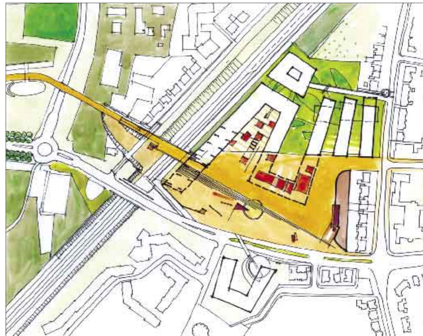
Het ROC, met de schaalniveaus uitgewerkt, rekening houdend met bezoekersstromen, gebruik en veiligheid.

Het komt de leefbaarheid van het gebouw ten goede als de stappen van de reeks niet te ver uit elkaar liggen. Een grote centraal gelegen ruimte met daarom heen dichte