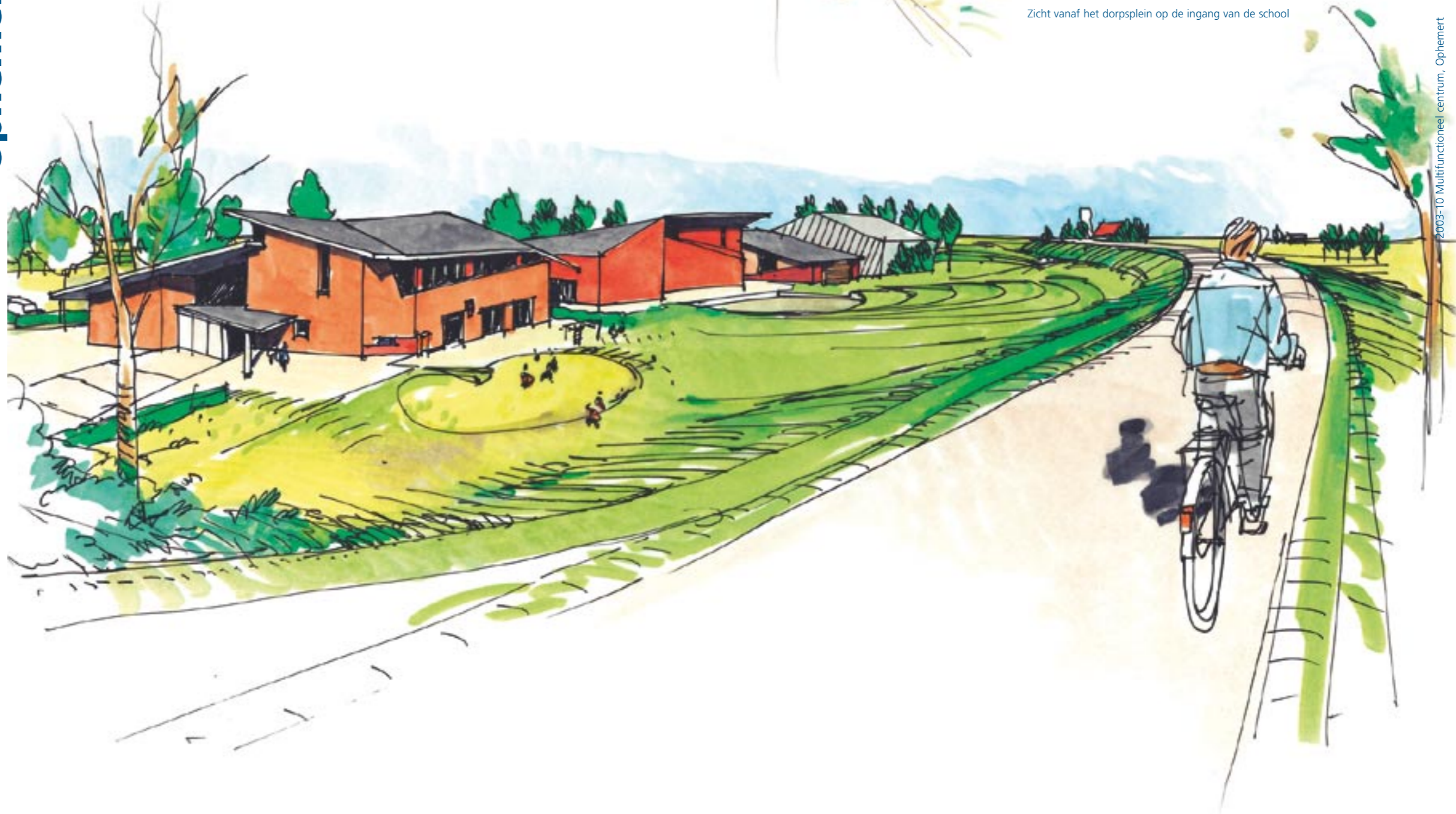
Zicht vanaf het dorpsplein op de ingang van de school

76 “Het multifunctioneel centrum moet de identiteit van Ophemert versterken”, dat was voor de gemeente Neerijnen een belangrijk uitgangspunt. Mede daarom hebben wij aansluitend op de variëteit in gebouw- en dakvormen in het dorp een ‘Spel van Daken’ opgezet. De drie hoofdfuncties, de school, het dorpshuis en de sportzaal krijgen ieder een eigen gebouw met een eigen identiteit en een eigen uitstraling, maar zijn toch duidelijk ‘familie’ van elkaar. De gebouwen staan schijnbaar richtingloos op de locatie. Dit sluit aan bij de rest van het dorp, waar geen enkele woning op dezelfde afstand tot de rooilijn of de buren lijkt te staan. De dijk wordt een wezenlijk onderdeel van de locatie door er een openluchttheater in op te nemen. Vóór de school is ruimte gemaakt voor een dorpsplein.