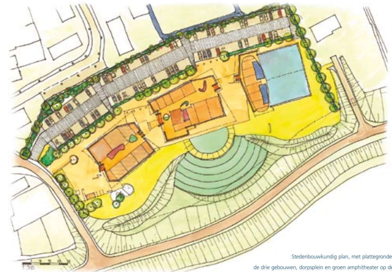
Stedenbouwkundig plan, met plattegronden van de drie gebouwen, dorpsplein en groen amphitheater op de dijk