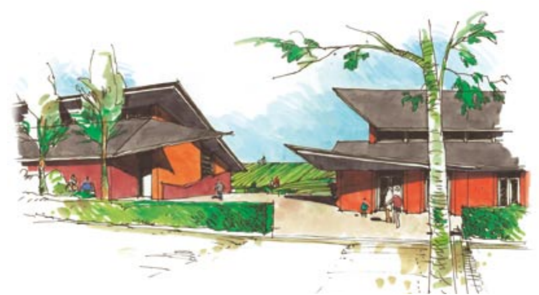
Ruimte tussen school en buurthuis. Zicht op het dijktheater