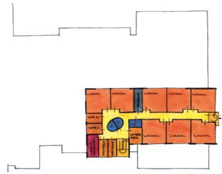
Nieuwbouw verdieping model 2